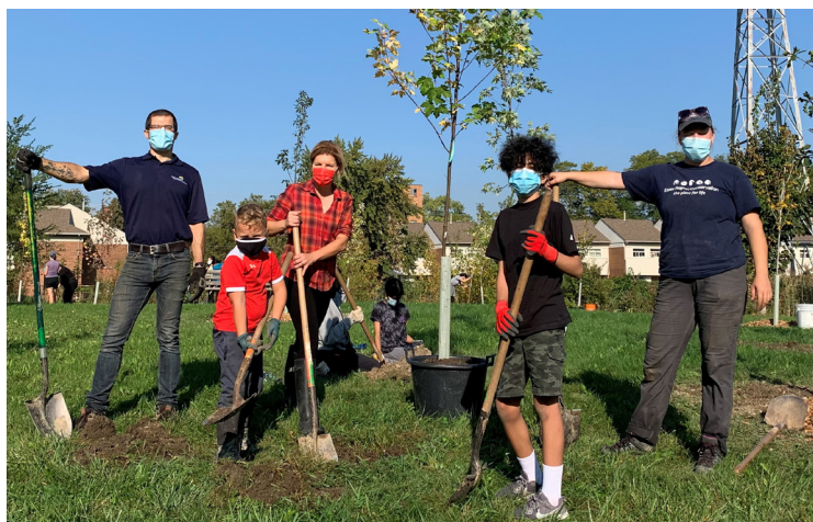
Voluntarios ayudaron a plantar 25 árboles nativos que estaban en macetas a lo largo del Bikeway Park, en College Avenue, en Sandwich.

Una iniciativa de ecologización similar tuvo lugar en el suroeste de Detroit en abril de 2021 con 250 árboles que se obsequiaron a los propietarios de viviendas en el área.