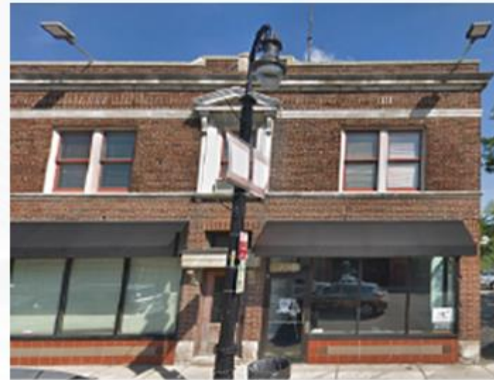
Southwest Detroit Community Office 7744 W Vernor Hwy. Detroit