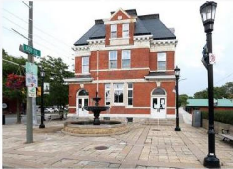
Sandwich Community Office 3201 Sandwich St. Windsor