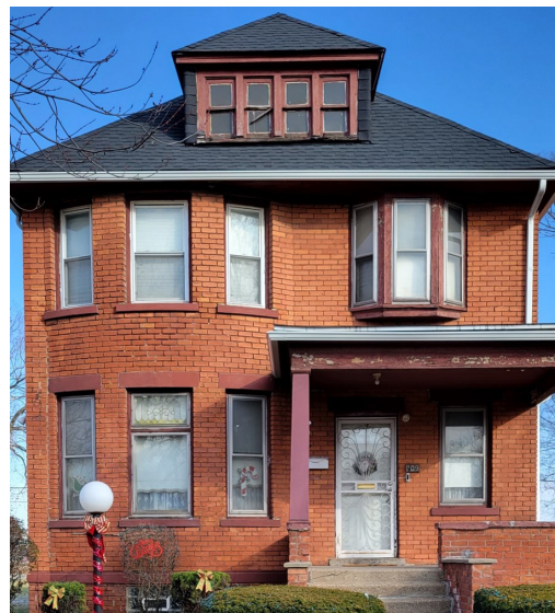
Le premier remplacement de toit effectué dans le cadre du programme de rénovation des maisons de Delray.