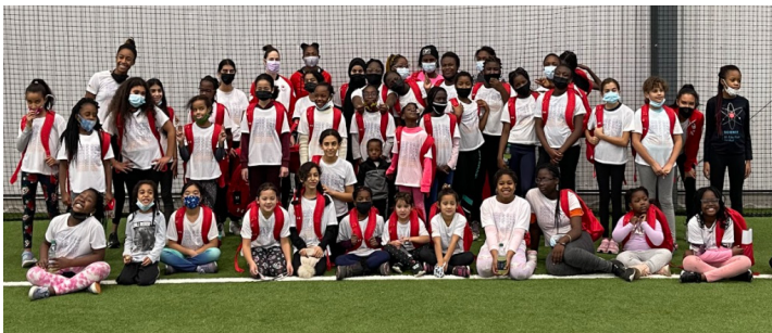
Plus de 70 filles ont profité de la série de sommets Girls Can en décembre.

Le Border City Athletics Club a reçu 10 000 $ pour soutenir la série de sommets Girls Can en décembre 2021. L'événement a permis à plus de 70 jeunes filles noires, autochtones, et de couleur d'être physiquement actives et de rencontrer des athlètes olympiques et d'élite de différents sports.