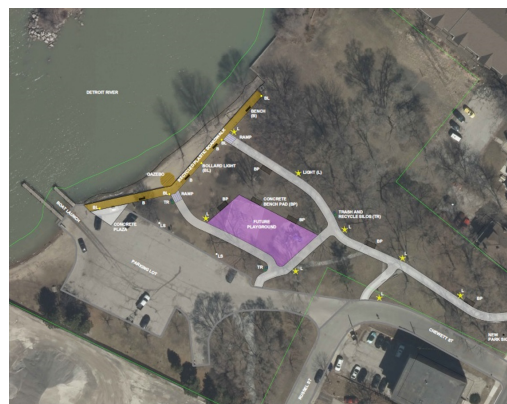
Les améliorations du parc McKee devraient commencer au printemps 2022.

En janvier 2022, la ville de Windsor a reçu 200 000 $ dans le cadre du plan d'avantages pour la communauté pour investir dans les parcs du quartier de Sandwich. L'investissement servira à la construction d'un nouveau pavillon et à l'amélioration de la passerelle existante du parc McKee. Ces aménagements seront exécutés par la ville. La construction devrait commencer ce printemps.